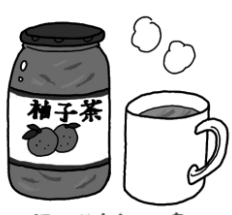
ほっこりやよい味

効能として、①風邪予防 ②体を温める ③美肌効果 ビタミンCがレモン(3倍)④リラクゼーション効果により安眠が期待できる⑤抗がん効果⑥毛細血管の保護⑦消化促進⑧活性酸素を除去する働きにより、新陳代謝を上げダイエットに繋がる⑨二日酔い改善