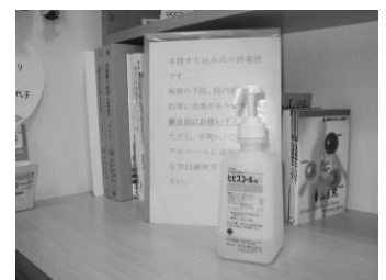
手指すり込み式の消毒薬